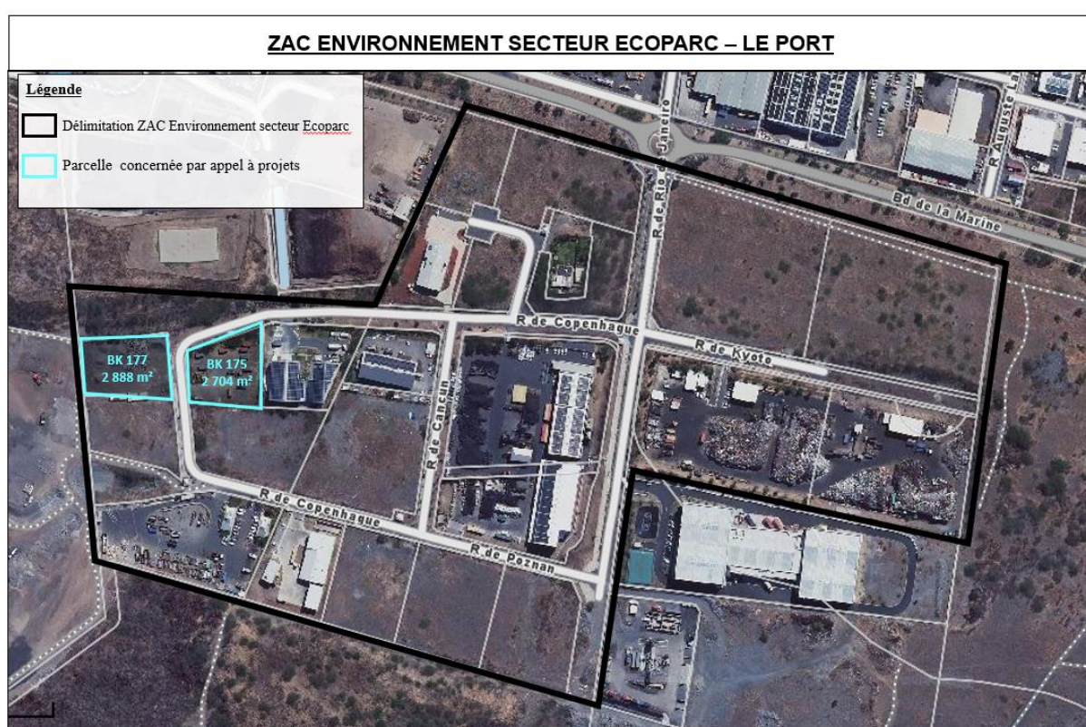
Figure 3 : présentation des lots à commercialiser

Les lots commercialisés sont les lots BK 175 et BK 177 situés dans la zone tel que représenté sur le plan ci- dessous.