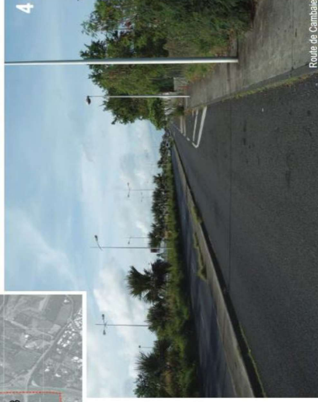
Route de Cambaie