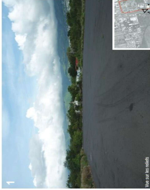
Vue sur les reliefs