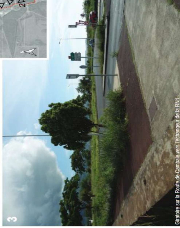
Giratoire sur la Route de Cambaie vers l'échangeur de la RN1